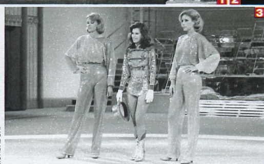
1] WANDA OSIRIS NEL VARIETÀ OKAY FORTUNA! AL TEATRO POLITEAMA DI GENOVA NEL 1956 2] ARTURO BRACHETTI (ANCHE NELLA PAGINA ACCANTO) NEL SUO TEATRO LE MUSICHALL DI TORINO 3] LE GEMELLE KESSLER CON LA CANTANTE E ATTRICE AMERICANA BONNIE BIANCO OSPITI DEL VARIETÀ TELEVISIVO DI ENRICO FALQUI AL PARADISE NEL 1984

zincò dorate del suo teatro torinese - l'ex-Juvarra, che oggi si chiama Le Musichall - Arturo Brachetti, illusionista, trasformatista, un po' mago, racconta appassionato la rinascita del varietà. Il ciuffetto di capelli a punta sul capo («è un segno di riconoscimento, come i baffetti per Chaplin») apparentemente fragile nel corpo lungo e filiforme, in realtà un piemontese testardo e soldatino, Brachetti dice che il varietà, dopo il melodramma, è il genere teatrale più "nostro". E anche per questo lui gli ha dedicato questo suo teatro, un intero spettacolo prodotto per un gruppo di giovani, Le Musichall in tour (dal 10 gennaio 2019 tornerà in scena a Roma al Teatro Vittoria) e il suo ultimo show, Solo , una summa di tutto quello che lui sa fare nell'arte della trasformazione e dell'illusione: un vero successo, 18mila biglietti venduti solo a Milano il mese scorso, dove tornerà a grande richiesta in novembre, oltre che a Napoli e Torino. E per la prossima stagione, che presenterà ufficialmente tra qualche giorno, le novità sono tante, con presenze internazionali di prim'ordine.