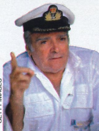
«IL MIO VERO MAESTRO È STATO RIVIÈRE. NEI SUOI LOCALI L'ULTIMA SCINTILLA DEL MUSICHALL»

«L'avrebbe detto che dal circo felliniano sarebbe un giorno nato qualcosa come il Cirque du Soleil? Eppure la radice è quella, esattamente come cent'anni fa il varietà si rifaceva alla tradizione del café chantant. L'artigianato rustico delle origini si è spin-