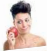
Una delle attrici del festival di donne clown. In alto: una delle attrici del festival di donne clown.

Lebberive e ispirare nuove generazioni di pagliacce. Arriva in Italia il primo festival internazionale di donne clown. Dal 13 al 20 novembre, sotto le Chiappe Madera montate negli spazi del Bunker, è in programma un cartellone di spettacoli tutti affermati che coinvolge oltre 25 compagnie e artiste. Ci sono nomi internazionali come la francese Joana Bassi, personaggio d'eccezione del panorama internazionale del teatro popolare e comico con un