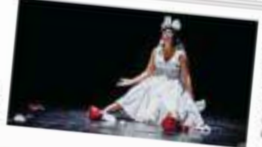
Una delle attrici del festival di donne clown. In alto: una delle attrici del festival di donne clown.