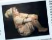
Una delle attrici del festival di donne clown. In alto: una delle attrici del festival di donne clown.