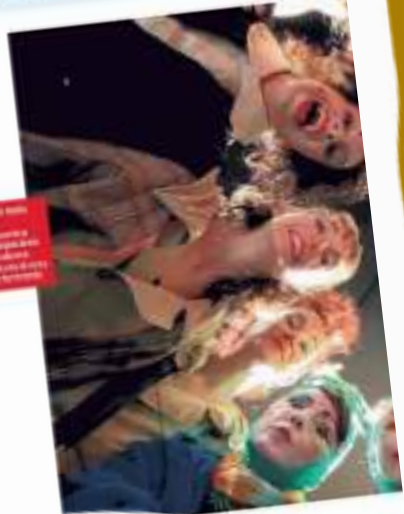
Una delle attrici del festival di donne clown. In alto: una delle attrici del festival di donne clown.

Lo spettacolo è una provocazione e una riflessione sulla figura di Eva. Ghirelli esplora il ruolo della donna nella società e nella cultura. Il spettacolo è un'opera di teatro fisico e danza, con un linguaggio visivo e sonoro molto forte. Ghirelli utilizza il corpo e il movimento per raccontare la storia di Eva e il suo rapporto con Dio. Il spettacolo è un'opera di teatro fisico e danza, con un linguaggio visivo e sonoro molto forte. Ghirelli utilizza il corpo e il movimento per raccontare la storia di Eva e il suo rapporto con Dio. Il spettacolo è un'opera di teatro fisico e danza, con un linguaggio visivo e sonoro molto forte. Ghirelli utilizza il corpo e il movimento per raccontare la storia di Eva e il suo rapporto con Dio.